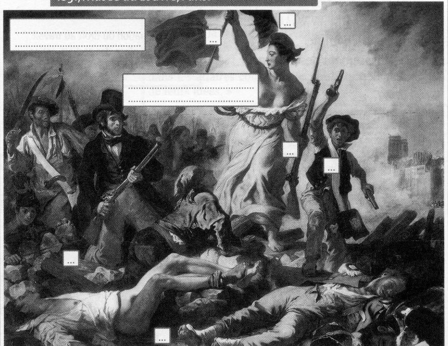
Doc. 2 Eugène Delacroix, La Liberté guidant le peuple , 1831, Musée du Louvre, Paris.

Charles X remet en cause les acquis de la Révolution de 1789 en signant quatre ordonnances tendant à supprimer la liberté de la presse et à modifier la loi électorale. C'est une violation de la Constitution. Et c'est la révolution à Paris, les 27, 28 et 29 juillet 1830, journées appelées « Les Trois Glorieuses » : c'est la fin de la Restauration et des Bourbons.